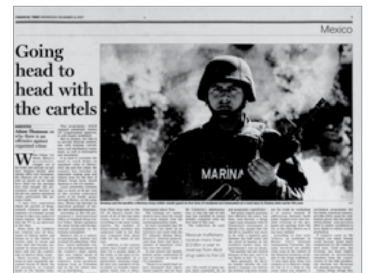
"Going head to head with the cartels." Mexico. Financial Times , 12 Dec. 2007