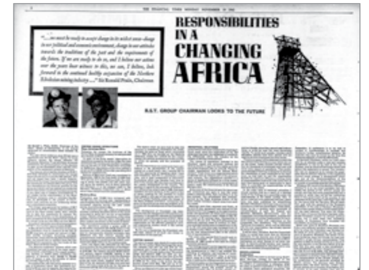
"Africa." Financial Times , 19 Nov. 1962