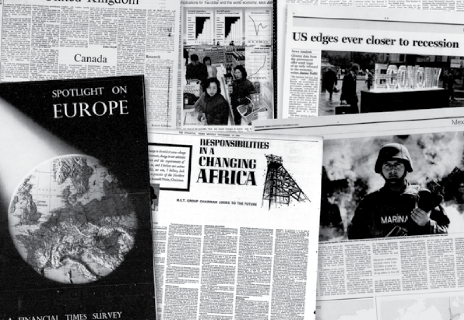
Various sources. Primary Source Media. Financial Times Historical Archive 1888-2016 .