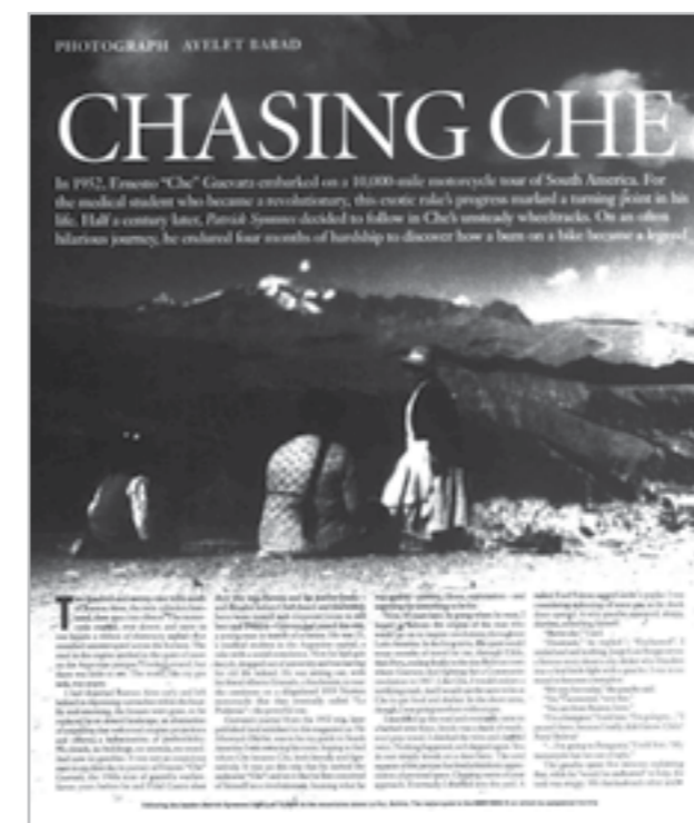
“Chasing Che.” Independent on Sunday , 11 Mar. 2001