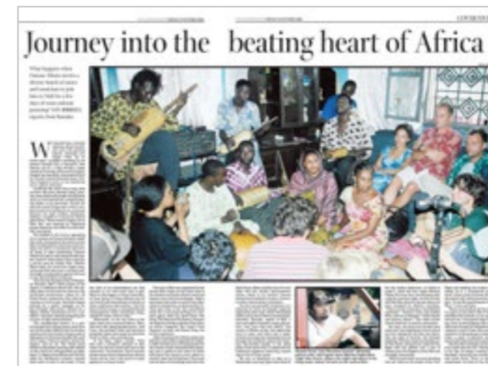
“Journey into the beating heart of Africa.” Arts & Books Review, Independent , 13 Oct. 2006