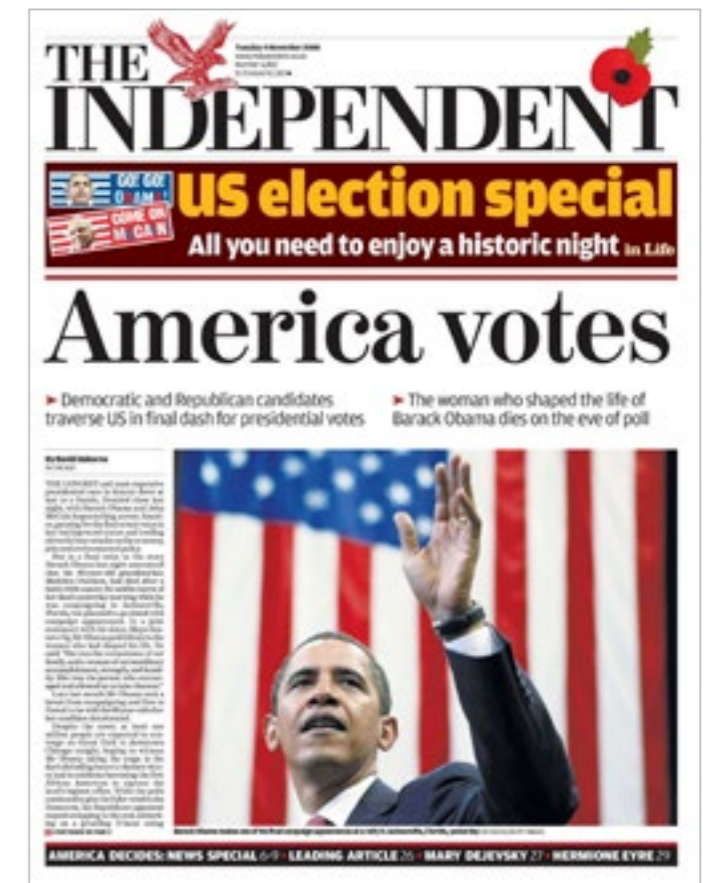
“America votes.” Independent , 4 Nov. 2008