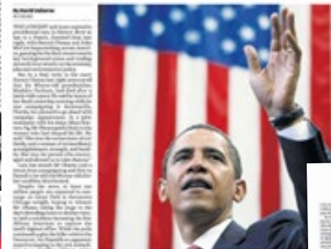
AMERICA DECIDES: NEWS SPECIAL 0-0 LEADING ARTICLE 26 MARY BELL

Democratic and Republican candidates traverse US in final dash for presidential votes