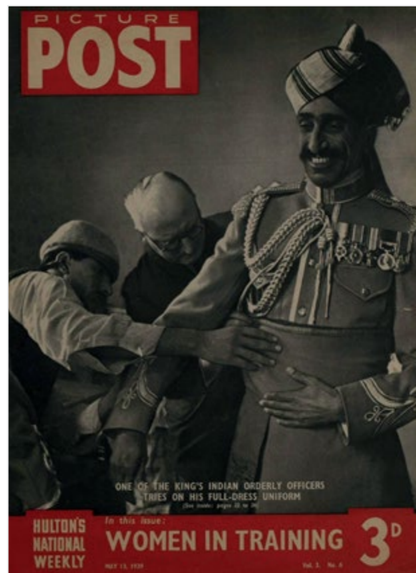
Picture Post, May 13, 1939