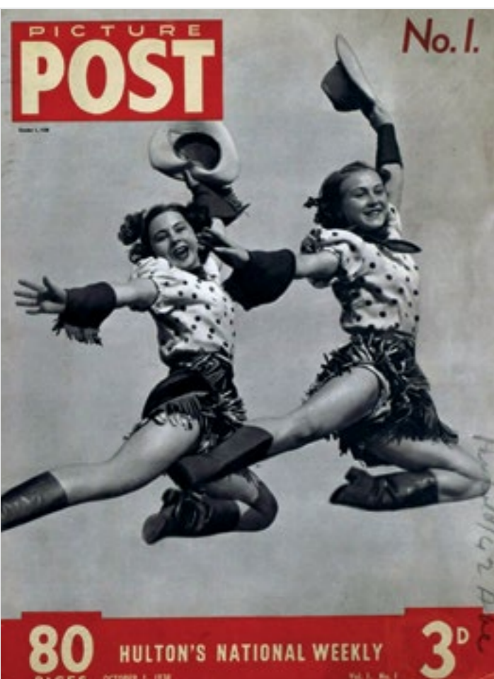
First Edition, Picture Post, Saturday, October 01, 1938