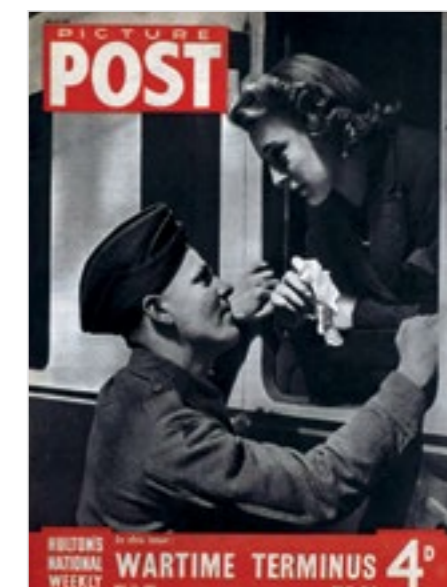
Picture Post, May 23, 1942