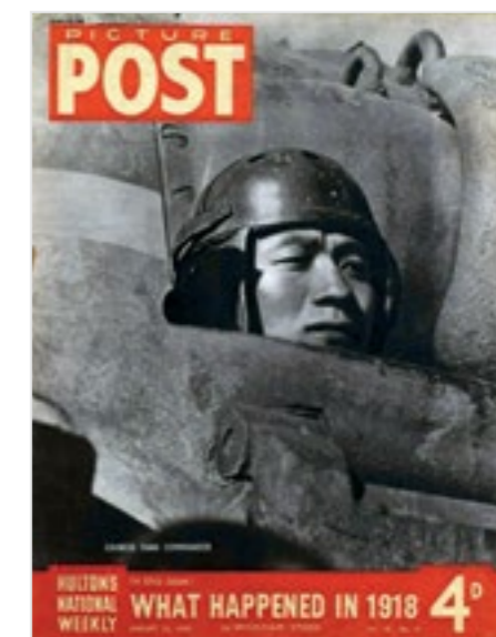
Picture Post, January 23, 1943