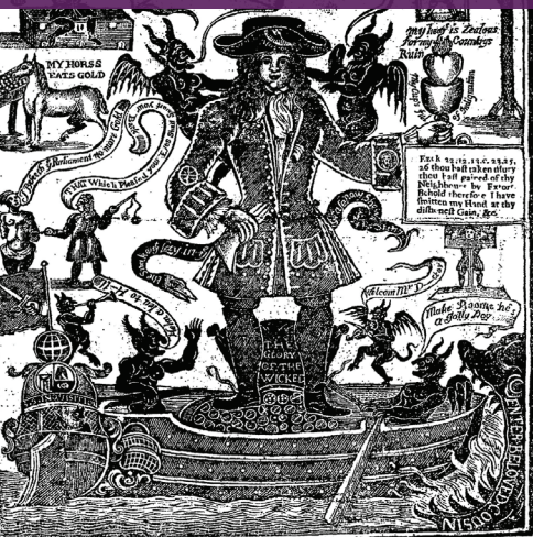
Various sources. Primary Source Media. 17 th and 18 th Century Burney Newspapers Collection

“十七世纪和十八世纪伯尼报纸典藏”是源自大英图书馆的、现存最大型的17世纪和18世纪英国新闻出版物独立典藏，包括超过1,000种这一时期的小册子、公告、新闻簿和报纸。它涵盖200年的新闻报道、辩论和观点，不仅来自于英国本土，也有不少出版物来自于英国殖民地。